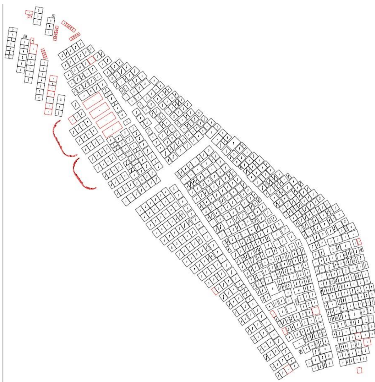
TABELA 3: Okvirni tehnični normativi za grobove v skladu z Odlokom